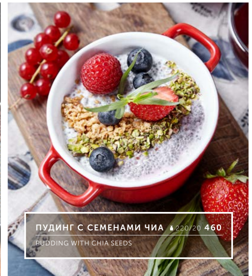
ПУДИНГ С СЕМЕНАМИ ЧИА 🕒 220/20 460 PUDDING WITH CHIA SEEDS