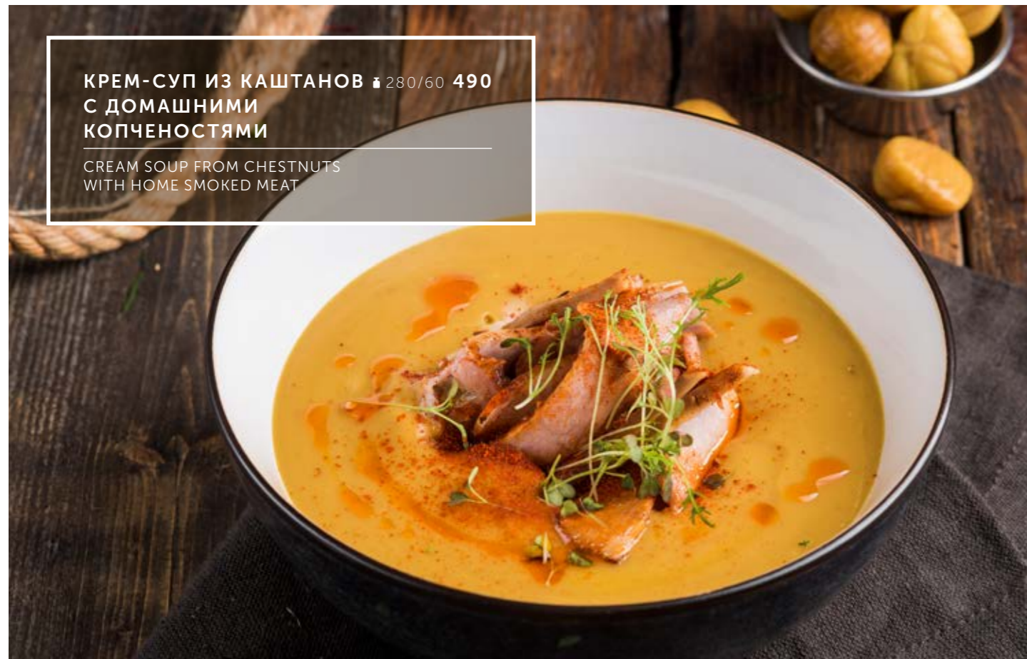
КРЕМ-СУП ИЗ КАШТАНОВ ₴ 280/60 490 С ДОМАШНИМИ КОПЧЕНОСТЯМИ

CREAM SOUP FROM CHESTNUTS WITH HOME SMOKED MEAT