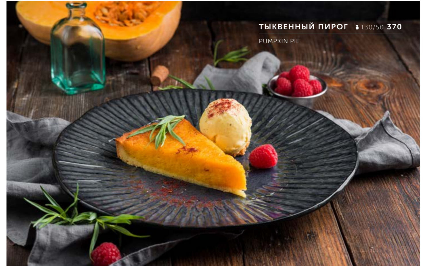
ТЫКВЕННЫЙ ПИРОГ 🕒 130/50 370 PUMPKIN PIE

QUAIL WITH MILLET, BERRY SAUCE AND SMOKED CHERRY