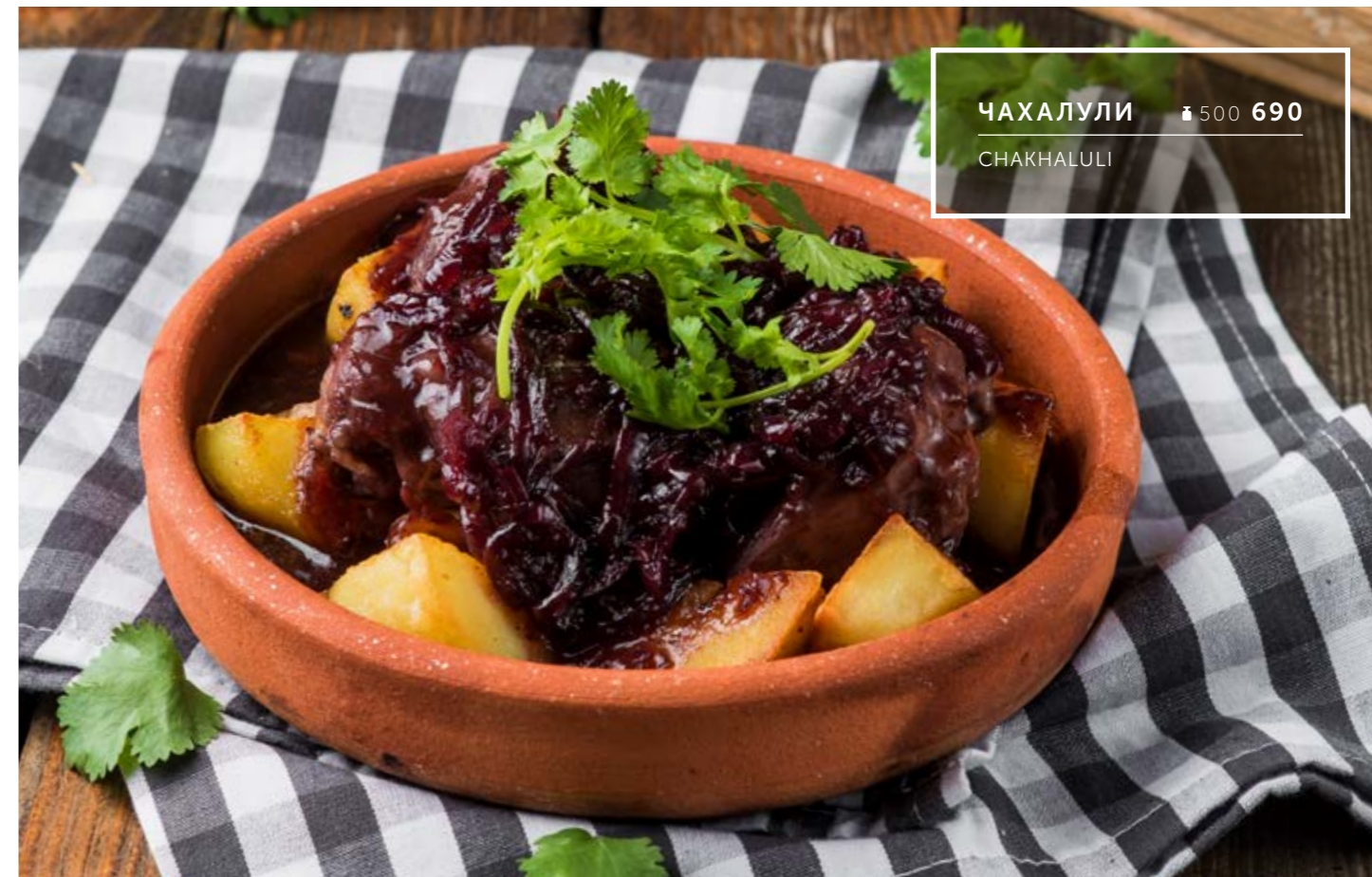
ЧАХАЛУЛИ ₴ 500 690 CHAKHALULI

ПОЖАЛУЙСТА, СООБЩИТЕ ОФИЦИАНТУ, ЕСЛИ У ВАС ЕСТЬ АЛЛЕРГИЯ НА КАКИЕ-ЛИБО ПРОДУКТЫ PLEASE TELL THE WAITER IF YOU HAVE ALLERGY TO ANY PRODUCTS