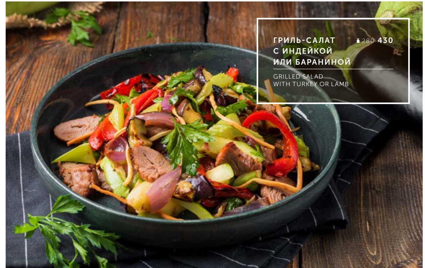
ГРИЛЬ-САЛАТ ₴ 280 430 С ИНДЕЙКОЙ ИЛИ БАРАНИНОЙ

WARM SALAD WITH CHICKEN LIVER AND SEASONAL MUSHROOMS