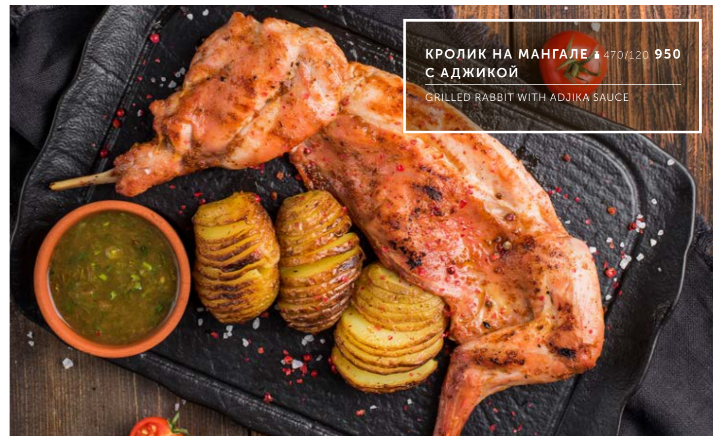
КРОЛИК НА МАНГАЛЕ ₴ 470/120 950 С АДЖИКОЙ