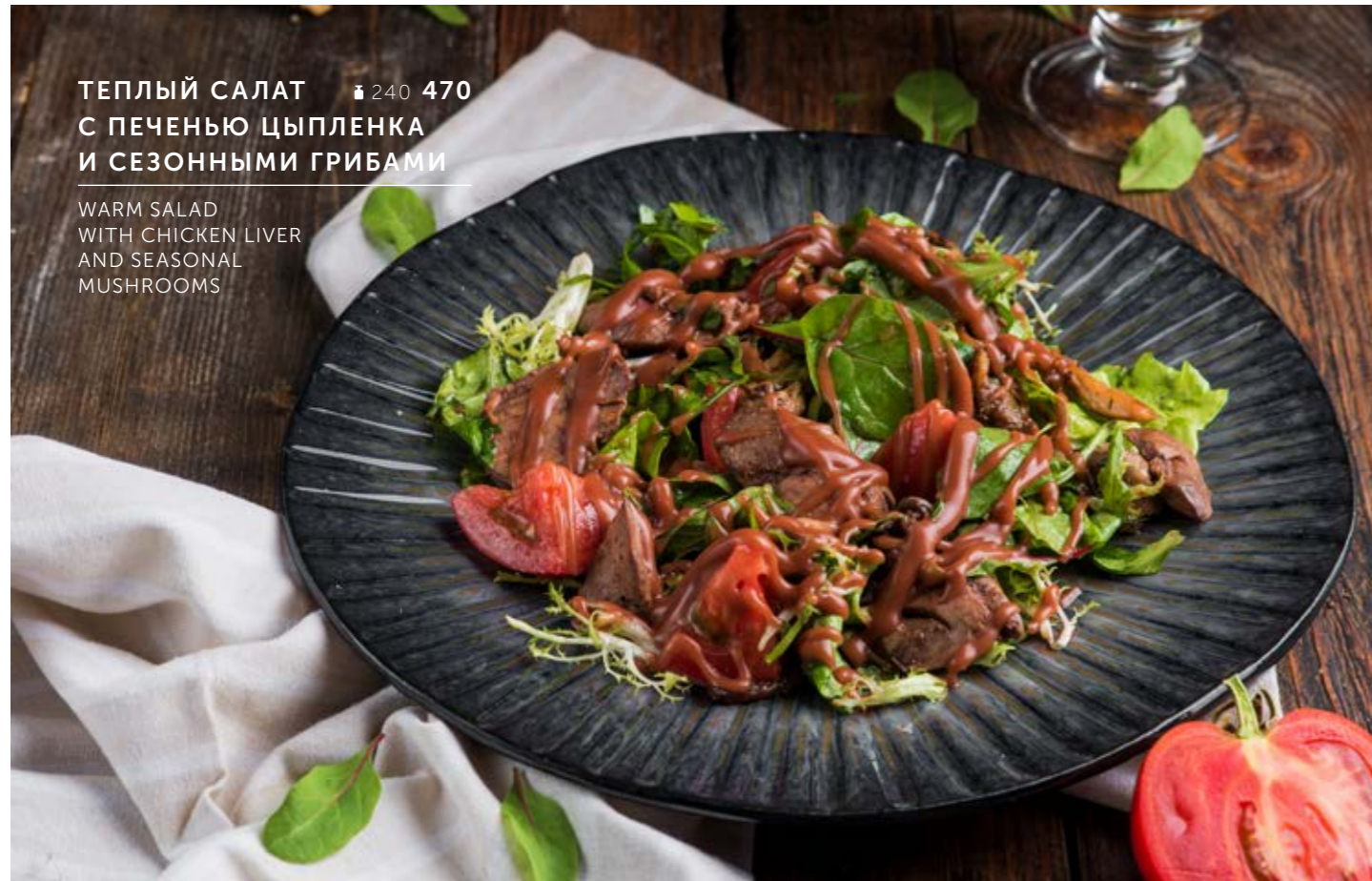
ТЕПЛЫЙ САЛАТ ₴ 240 470 С ПЕЧЕНЬЮ ЦЫПЛЕНКА И СЕЗОННЫМИ ГРИБАМИ

WARM SALAD WITH CHICKEN LIVER AND SEASONAL MUSHROOMS