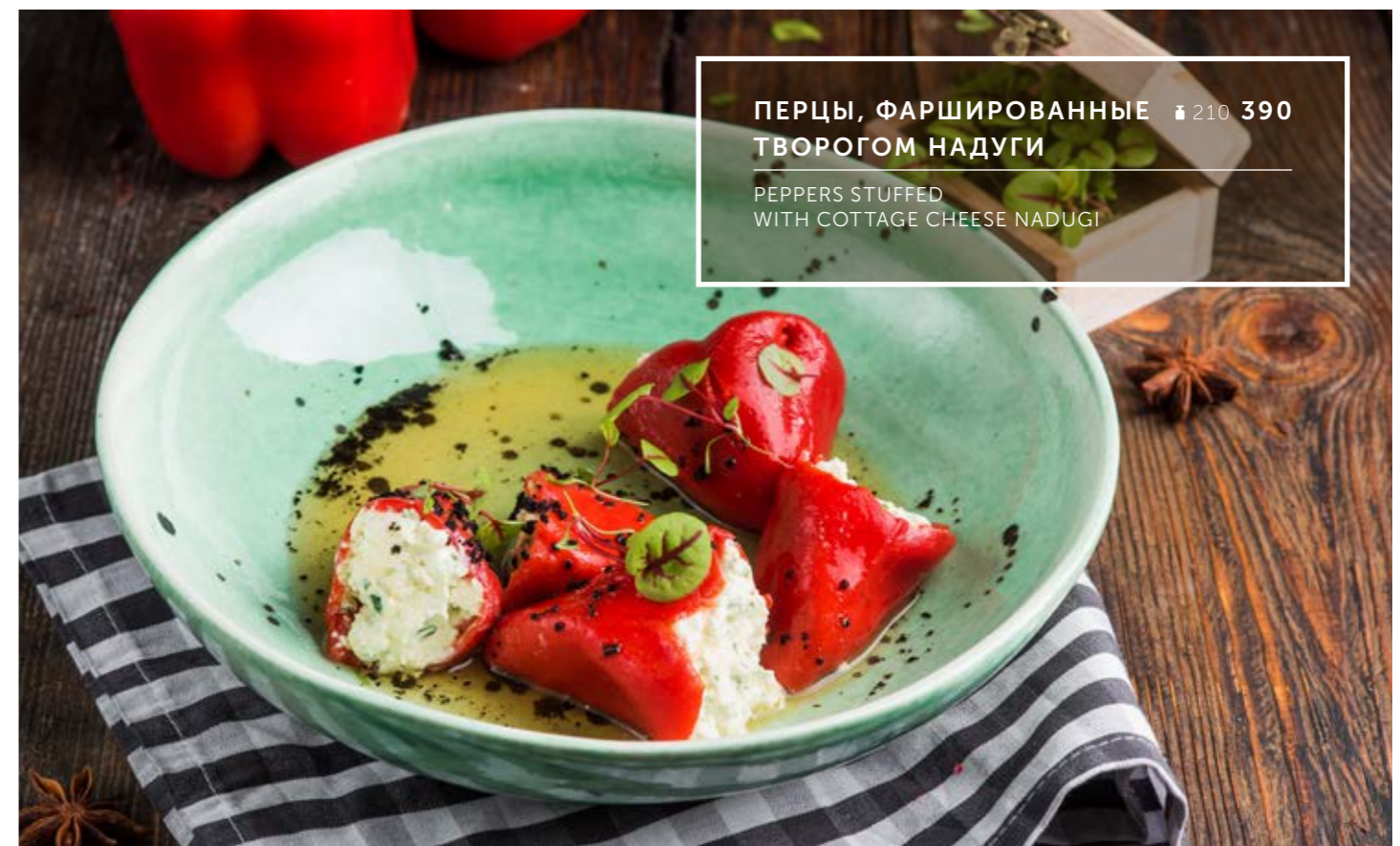
ПЕРЦЫ, ФАРШИРОВАННЫЕ ₴ 210 390 ТВОРОГОМ НАДУГИ

PEPPERS STUFFED WITH COTTAGE CHEESE NADUGI