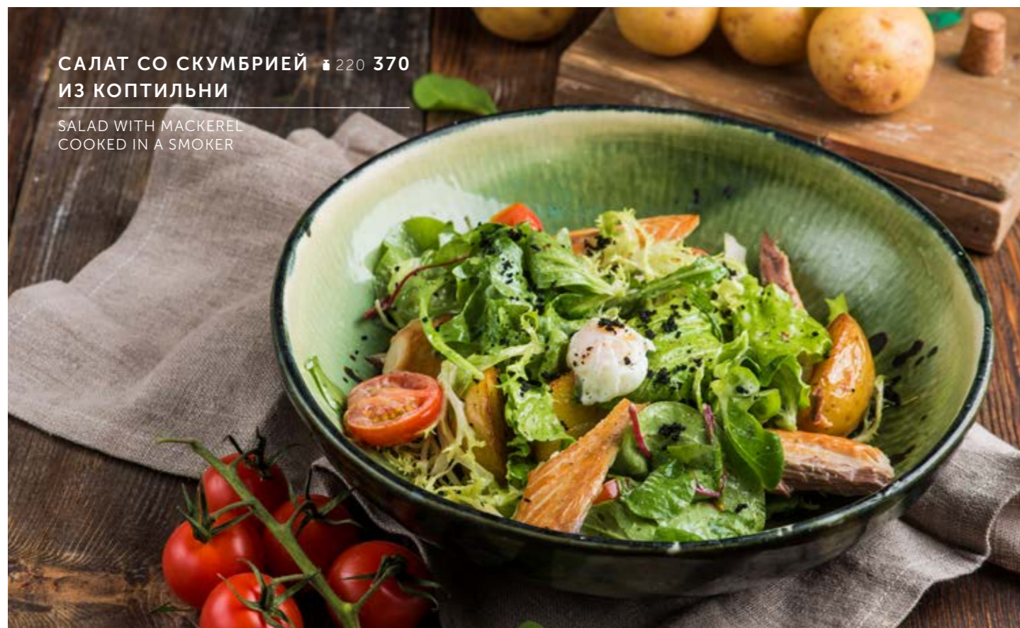
САЛАТ СО СКУМБРИЕЙ ₴ 220 370 ИЗ КОПТИЛЬНИ