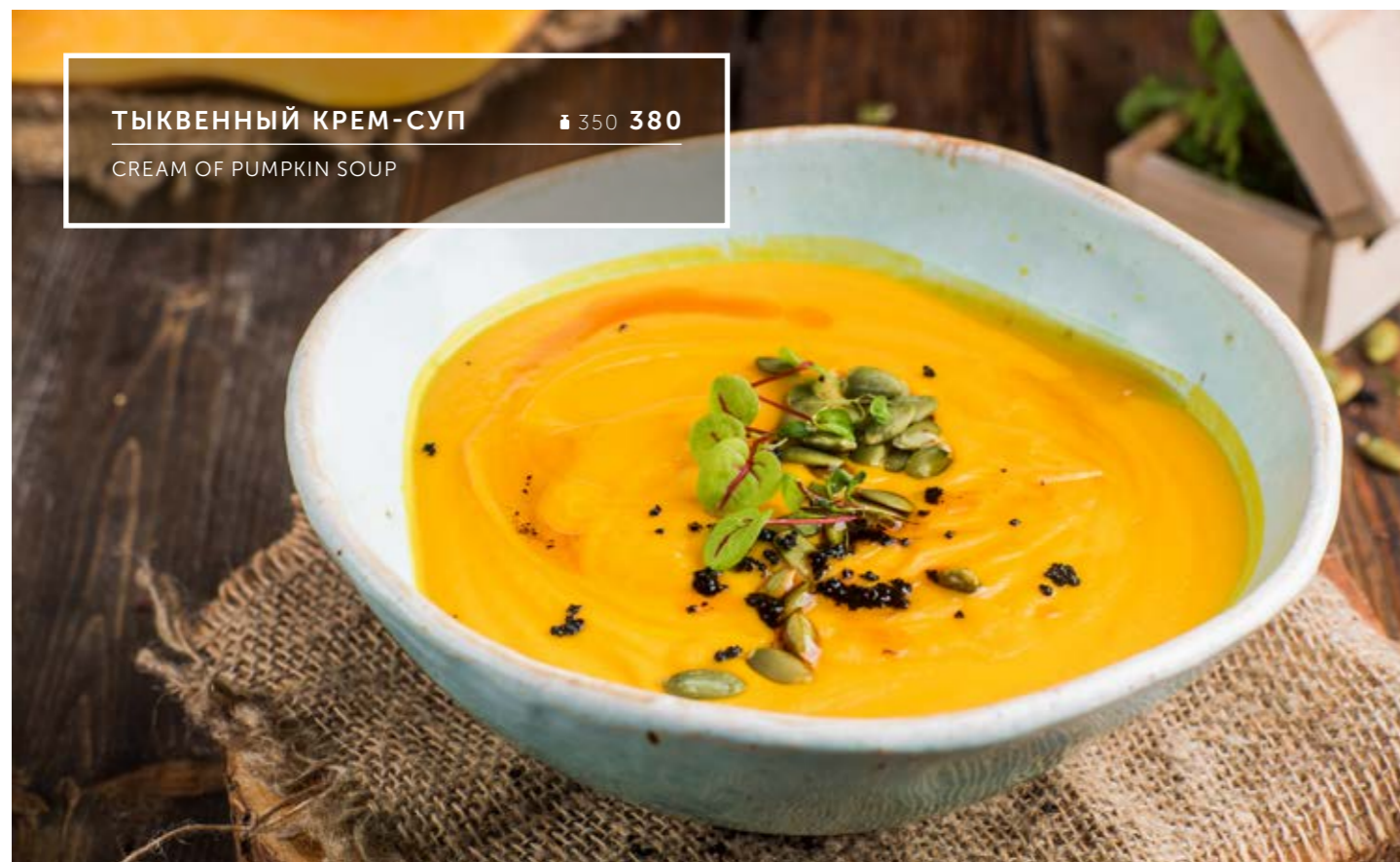
ТЫКВЕННЫЙ КРЕМ-СУП ₴ 350 380

CREAM SOUP FROM CHESTNUTS WITH HOME SMOKED MEAT