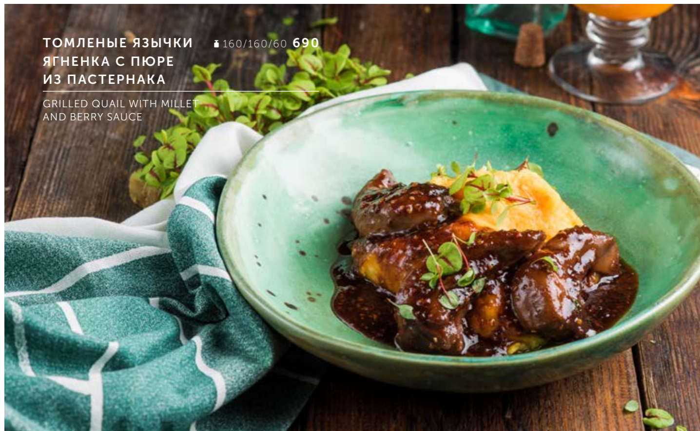
ТОМЛЕННЫЕ ЯЗЫЧКИ ЯГНЕНКА С ПЮРЕ ИЗ ПАСТЕРНАКА